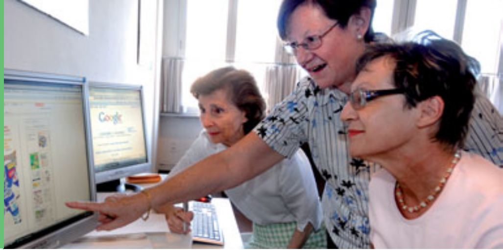
Bildung und Kultur: Computerkurse